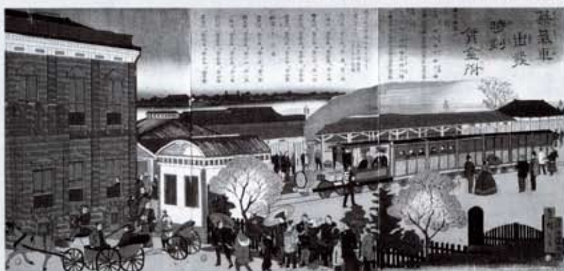
蒸気車出発時刻資金附