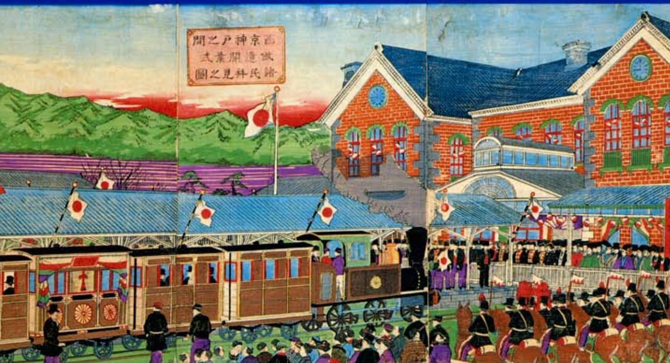
西京神戸之間鉄道開業式諸民拜見之図(神戸市立博物館所蔵)