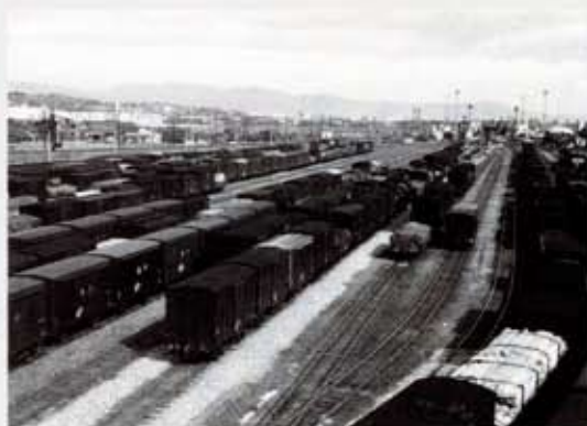
吹田操車場写真 昭和36年頃