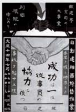
自動連結器導入ポスター (個人蔵)