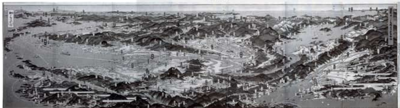
近畿を中心とする名勝交通鳥瞰図